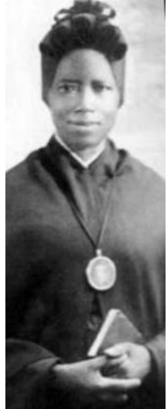
Sv. Bakhita nosila privesok s obrazom Sedembolestnej Panny Márie, patrónky Slovenska.

O blížnych sa Sestra Bakhita vždy starala s láskou, jej neustály úsmev si získaval srdcia ľudí, tak ako jej pokora a jednoduchosť. V staršom veku, keď ochorela, vrátili sa jej bolestné spomienky z čias otroctva a modlila sa: „Prosím, uvoľni reťaze... sú ťažké!“ V roku 1992 pápež Ján Pavol II. vyhlásil Jozefínu Bakhitu za blahoslavenú a neskôr v r. 2000 za svätú.